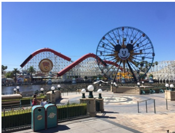
迪士尼加州冒险乐园

时间飞快，转眼间我已经离开洛杉矶2月有余了。但一切好像是昨天刚刚发生的事一样。加州温暖的阳光，热情的老师同学，美丽的校园，一切都化作美好的记忆，在我心中永留。9月11日，我和一行6位复旦的小伙伴到达了洛杉矶国际机场，迎接我们的是提前在UCLA中国学生会预订的接机服务。到达了Airbnb之后，我们在LA欢乐的日子拉开了帷幕。旅行生活篇 LA 是美国第二大城市，规模仅次于纽约。在LA，你既可以去环球影城，好莱坞体验被各种电影大IP包围的感觉；也可以去太平洋海岸，圣莫妮卡海滩，威尼斯海滩听海浪的声音；也可以去洛杉矶的迪士尼乐园以及旁边的加州冒险乐园，那里有全世界最早的一家迪士尼乐园供你探险。你还可以去downtown LA，那里有小东京，韩国城，唐人街，满足来自亚洲的胃；去到格里菲斯天文台，远眺LA市景，可以说是“天上有星星，地下有灯火”，那里也是电影La La Land的拍摄之地，一行人面对着万家灯火齐声哼唱City of Stars 甚至是整个大学四年里不多让人动容的时刻。