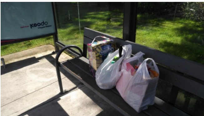
(添置日常用品，日常起居自给自足)

机场到校园地道路两旁错落散布着住宅，静谧而温和的环境令人心身放松。然而，没有更多时间让我们观光这座城市，第一步要做的就是熟悉UBC的校园、以及周边的生活设施。UBC的校园非常大，校园里有一条即宽且长的道路University Boulevard，两旁有博物馆、生物楼、化学楼、实验室和图书馆，在道路的中央，常有各种各样的社团活动，而道路的两旁，同学们的欢声笑语总能让校园充满活力。我居住的地方是位于校园东南片区的Fairview Crescent，高高的枫树沿路生长，是实至名归的“美丽景色”。宿舍以4人为一个单元，有单独的房间和厨房，宿舍的南边是居民区和大大的草坪，平时非常安静，是学习的好地方。美中不足的是，宿舍的位置距离上课的地方较远，暴雨来袭的上学路上会有些寒冷和潮湿，但沿街漫步、即使是风雨中也别有一番滋味。在距离宿舍五分钟左右的Village有书店、银行、餐馆，晚上下课后非常热闹，在那里也可以买到食材和生活用品。在简单的报到、注册，和住宿区破冰的“热狗派对”之后，我们在Bookstore购买了已经网上缴费的交通卡实体卡，这张卡可以无限乘坐市内交通，对于短期居住的学生而言非常方便。