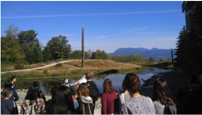
(Orientation活动，参观原住民文化标志图腾柱)

Part1 初来乍到：海边花园UBC的魅力 第一次来到这座位于加拿大西部海岸的城市，铺洒在海平面上的灿烂阳光、山峦叠嶂间漂浮的白色云彩、北方干燥晴朗的秋季气候是温哥华给我的第一印象——我不禁想起UBC的别名“海边花园”、“北美最美的大学”。从确定交流学校、到真正来到温哥华，有足足一个学期的时间让我们做好心理准备。但是回想抵达温哥华的第一天，我依然能想起当时紧张且兴奋的情绪。飞机降落在温哥华国际机场，欢迎我们的是热情的学长学姐们——UBC的中国学生会CSSA会在每学期初提供接送、机的志愿服务，为海外的中国游子们送来一份来自祖国的温暖。看着相似年纪的学长学姐们井然有序地组织同学们上下车、互相交流院系和专业，异国他乡的陌生感一扫而光。