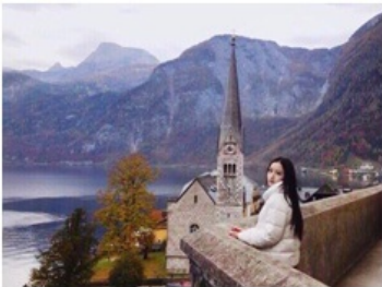
（最美小镇哈尔施塔特——一场说走就走的旅行，和国内的旅游小镇不同，这里没有被游人打扰，保持着一份独特的安详宁静）

（Chinese五人组的火锅红酒聚餐） 五、 与欧洲的深交——我的旅程 在出国交流期间，我游览了欧洲的十个国家，也认识了许多来自世界各地的朋友。我常常参加学校交流办公室举办的同学集体旅游项目，先后走过了近十个国家：奥地利、德国、法国、挪威、丹麦、捷克、匈牙利、意大利、瑞典。在学校组织的旅行中，交通工具为他们事先约定好的巴士，负责接送我们。在每个景点都会有当地国家的成员充当我们的导游为我们介绍历史背景。值得一提的是，在白天的旅途劳顿后，在晚上我们都会到当地的酒吧体验当地的人文风情，也尝遍了欧洲各地的美酒。在每次旅游之前，我们都做好了详细的安排。从预定机票到每个景点的时间安排，我们都事无巨细地列好了行程单以及预计花费。由于我们有事先充分的安排，这几次旅行都十分轻松愉快，也没有出现突发情况。