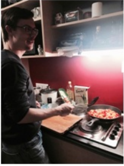
（我的buddy-S在我的宿舍做菜）

的doctor开具转诊单才能够到医院就诊的，这与国内大医院不同。国内的大医院都十分拥挤，但维也纳的大医院面积非常大但是人非常少，除了一些住院的到处走动的病人，看不到匆忙看病的就诊人员。辗转多家诊所后，我发现大多私人诊所都没有开门，需要提前和医生预约。由于我是交换学生的关系，我没有当地的医疗保险，也没有私人医生，这是一个比较棘手的问题，因为没有医生的诊断单，我甚至无法到药房买到药品。最后，在我的好朋友给了我几个医生的邮箱，我一一发邮件询问医生的时间，预约就诊。等到有医生回复的时候，距离我发病的第一天已经过去了一个星期，我的病也已经痊愈了。所以以后的同学要提前做好这方面的准备。（教授同意了我的补考，图略） 四、 熟识——我的朋友们 在到达维也纳之前，我们复旦的两名同学与人大与中政大的同学取得了联系，在当地形成了一个小分队，便于各个方面的交流与帮助。在维也纳，我们又结识了许多华人朋友，这为我们在当地的衣食住行取得了较大的便利。还有一点是，我在出国之前认识了一个维也纳大学的毕业生作为我的buddy（可以在专门寻找buddy的大学网站获取相关信息），他告诉了我全面的有关选课、考试、当地风俗、出行等方面的信息，我们之间也建立了深厚的友谊。