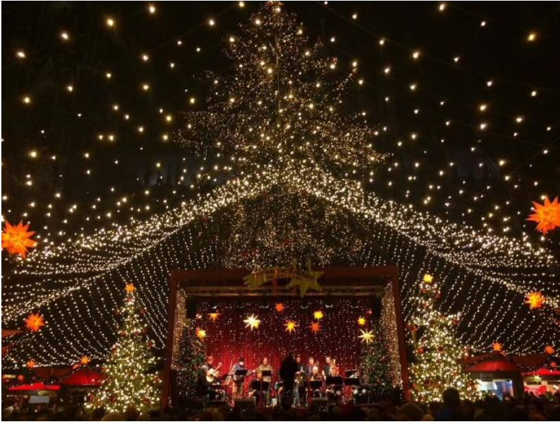
（科隆大教堂前的圣诞集市）

文之间的差异点），由此结识了一位非常要好的朋友，也给了我一份译制电影的特殊经历（华语电影在德国上映非常少，我的邻居表示听中国人亲自讲解中国的电影会有完全不同的观影体验，我是他在科隆认识的唯一的中国人，如果不是机缘巧合可能德国观众们看电影时就会有很多似懂非懂的地方了，并且表示他以后会愿意尝试译制更多话语电影）能为中国电影在国外的传播贡献小小力量这本身就是一件极具幸福感、成就感的事；通过couchsurfing结识了很多世界各地的朋友，素昧相识却给予了无私的帮助；平安夜时门外鞋里意外塞满了礼物；科隆狂欢节时路边的小姐姐热情的拥抱和洋溢在整个城市的欢乐氛围（科隆狂欢节是继巴西狂欢节的世界第二大狂欢节）以及圣诞氛围超级浓厚的科隆大教堂门前的圣诞市场；在马德里旅行时正值三王节，亲眼见到了声势浩大的花车游行，异常激动；有一次坐大巴回家途中路遇火烧云，眼前美好的景象真的给我一种被幸福紧紧包裹的幸福感。