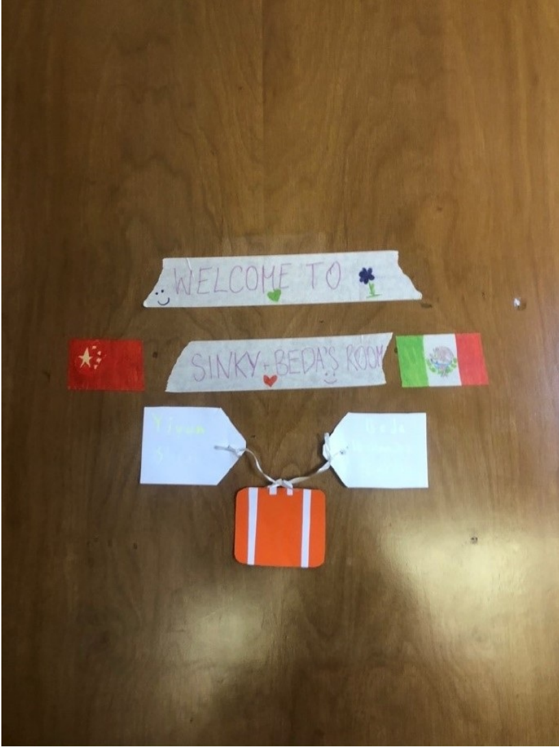
贴在寝室门口的可爱贴纸

由于我早就订了学期结束前往美西的机票，所以在考试结束后，我几乎是全宿舍楼第一个离开学校的学生。整理好了行囊，和我的好朋友以及墙上贴着的可爱贴纸说了再见，坐着学校为我联系的车前往了斯蒂尔沃特地区机场。机场里竖着一块牌子，标着俄克拉荷马州立大学的LOGO和一句话：“Wherever your journey takes you, you can always come HOME.” 我看着这块牌子，开始回忆我在大洋彼岸度过的这宝贵的4个月的日子：在这座热情而坦诚的小城市里，我遇到了太多可爱又友好的人，虽然仅仅做了四个月的cowgirl，我早已把这里当做了我的家。回忆太长很难全部写下，就写写我在交流时的“惊奇际遇”，那些能让我感到新奇的瞬间。