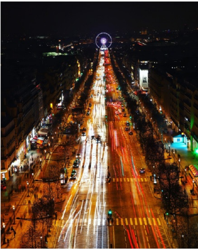
在凯旋门上俯瞰香榭丽舍大道的繁荣与浮华