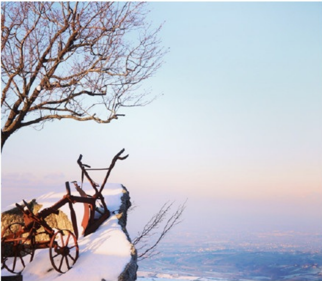
在圣马力诺的山顶俯瞰云雾之中的意大利