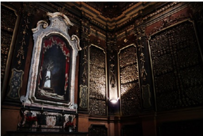
米兰圣贝纳迪诺人骨教堂 瘟疫和饥荒年代里的“迷人的恐怖”