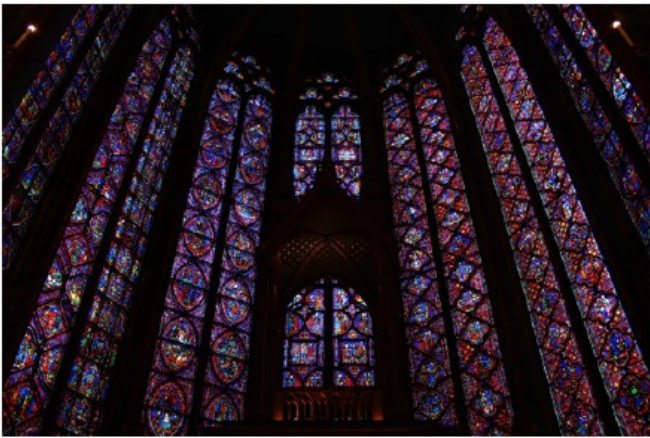
圣礼拜堂的彩色花窗 每一幅画都在述说一个古老的传说