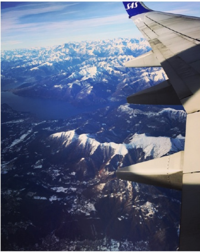
阿尔卑斯山脉的绝美