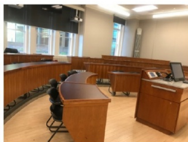
Goodes Hall 教室

虽然个人比较喜欢在寝室学习，没怎么去图书馆，但是 Queens 的图书馆环境还是十分不错的，Stauffer 作为最大的图书馆有好几层，也有不同的自习室以及可以预定的 study room，Douglas 图书馆相对小一些，但顶层是学校比较有名的 Harry Potter reading room，十分好看。