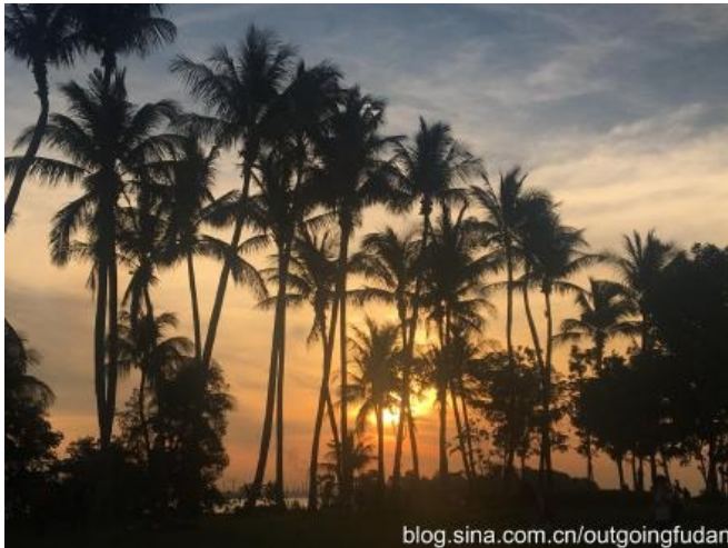
在亚洲的最南端（Southernmost Point of Asia Continent）看椰林落日

日语课上，大家通过日本传统游戏かるた学习单词 An Introduction to Literary Studies是我收获最大的一门课，授课方式为文本精读，体裁涉及诗歌、小说、剧本等。我在这门课上第一次接触后殖民文学，虽然有语言和文化的阻力，但越读越发现许多有意思的话题，比如英语写作和本土民族血液结合产生的张力，在社会层层运作中被沉默的个体，从西西弗斯困境中自我解救，等等。课程还为我阅读英语文学开辟了不同角度，宏观至整体的谋篇布局，细致至标点和语法的处理或几个同音词，都蕴含着作者的匠心。四个月的学习过程中，我遇到了一群可爱的老师，有趣的是他们中没有一位说标准英语，一学期下来吸收了Singlish、印度英语、日式英语等一箩筐奇特的口音，结实实地让我体验了新加坡的多元文化。于是第一个月，我一直过着上课努力跟上教授思路、课后对录音稿疯狂整理笔记的日子。从讨论课听不懂同学在说什么，notes一晚上看不完，以中文写作的思路写英文essay还犯了最基本的格式错误，到能够基本理解上课内容，完成一个完整的pre，写出像样的文章，虽然学得缓慢，但一路摸爬滚打下来非常满足。对我来说最难啃下的Art History，老师在最后一节课祝福我们“Keep shining!”，现在还时常激起阵阵涟漪。 城市漫步 新加坡有很多种探索方式，你可以在Marina Bay的璀璨灯火中吹晚风，到牛车水和小印度体验南洋风情，泡在博物馆里阅览亚洲文明的历程，或去动物园和游乐场做一回小孩子。我尤爱这里的自然风光，植物园和林间小道都是散步的好去处。几次去圣淘沙看海看落日，听浪拍沙滩的舒服的声音，夕阳像一汪金色的池水，在椰林间跃动闪烁。待到余晖也消失在海面，沿着夜晚的海岸线走回去，还能遇见一朵灿烂的烟花。