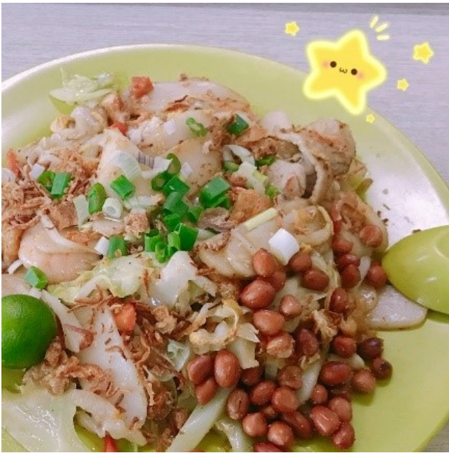
图5 学校里最喜欢的PGP年糕 对于价格而言，除meal plan外，校内普通的食物一顿3-6新币（折合人民币15-30元）以内可以解决，校外普通食物7-10新币（折合人民币35-50元）也可以解决；如果在餐厅同学聚会，人均100元人民币也基本足够（此处不包含豪华餐厅）。总体食物的物价略高于上海，但相比伦敦纽约而言物价还是低了不少的。特别要说的是，新加坡7-11与FairPrice等超市卖的水果折合成人民币不便宜。如果想吃便宜一些的水果，可以去食堂（比如FASS的Deck有卖便宜的瓜果，PGP有水果杯之类的），PGP里南洋超市的一些水果也比较便宜，可以去对比购买。