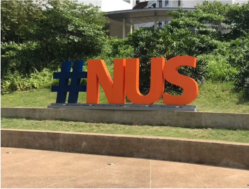
图1 新加坡国立大学 (NUS) 一、行前准备 去NUS是我从中学时期开始的愿望。对新加坡花园城市的印象很好，再加上环境差异不大，对短期交流而言是一个不错的选择。特别是之前交流的学长学姐评价也非常好，在outgoing fudan上也看了很多文章，最终确定了这个目标。对于想要在未来出国的同学，可以选择离自己出国意向地区较近的学校。建议尽早确定交流大致意向，在大二上学期之前把托福或雅思成绩考出来；但其实即使没有考出来，在面试确定之后再考也来得及，只不过会比较赶；如果不需要申请CSC奖学金，NUS是不需要托福成绩的，这一点也是可以考虑的因素。每个院系的面试选拔不太一样。从我的角度来说，在面试前，除了准备一些“你为什么想去这个学校”之类的问题，建议好好练习英语口语。比如早上可以自言自语用英文评价一段新闻，晚上可以回寝室和室友用英语聊聊天之类，虽然有时候很尴尬，但可以培养面试时的英语语感。其实在面试时，对口语语法的要求没那么高，只要能大胆、准确地表达出自己的意思就好。在确定学校以后，就是出发前的准备了。真心感谢学校与外事处对交流项目的支持，也感谢《NUS不完全交流指南》的梳理。虽然里面一些信息可能需要更新，但已经非常详细了，去交流之前可以认真读一读，备注一下自己要知道的重点。除此之外，如果想要找科研导师，建议在出行前就邮件联系好老师，在交流时提升科研经历也是很好的选择。

这是到目前为止，人生中最久的一个夏天。特别是与大四忙于升学的状态相对比，交流的几个月是可以静下来思考，不那么有peer pressure，也会让之后的自己常常怀念的时间。下面就从几个方面说一说我在新加坡交流的情况，也为自己这段交流时光做一个总结。