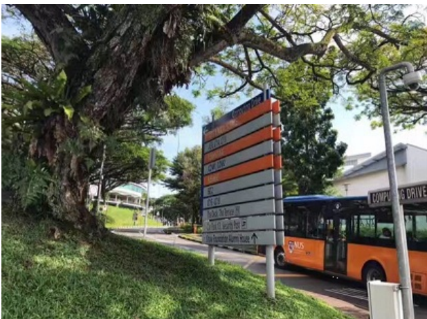
图7 NUS路牌与校车 六、 购物 刚到新加坡的时候，该带的东西尽量多带，特别是日常生活用品。因为新加坡网购不太方便，