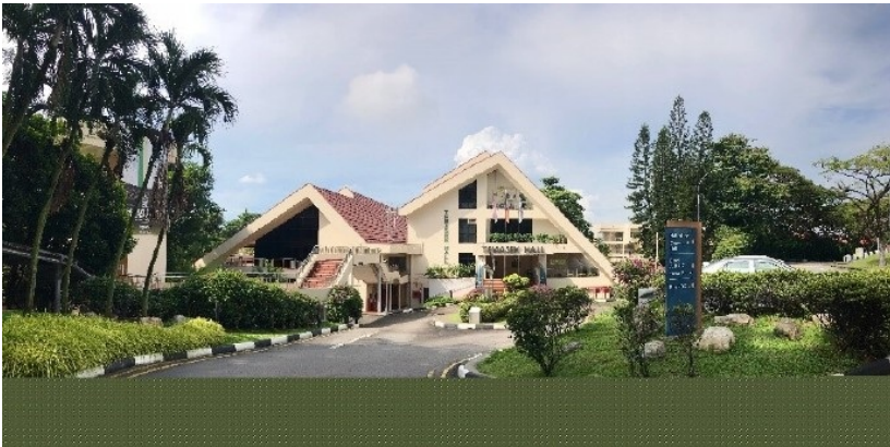
图4 所在宿舍楼远景 四、食物 在新加坡吃饭最大的好处，就是中式的食物很多，想吃到国内各地的食物也非常方便。新加坡比较常见的是中餐、东南亚菜（比如泰国、马来的食物）和印度菜，因为国际化程度高，所以吃西餐或其他想吃的菜系也非常方便。在校内，各个Hall会有强制一次性缴费的meal plan（包含周一到周六的早餐，周日到周五的晚餐），折合每一顿非常便宜。但一些Hall的meal plan真的很难吃，特别是吃多了以后更加不想吃；而且有时候早餐是起不来的，周末也得另外觅食，所以meal plan的存在比较尴尬。如果因为便宜的meal plan而选择住Hall，我个人认为是不划算的。除Hall的食物之外，还可以选择周末不歇业的PGP与UTown。UTown食物选择比较多，我自己还是很喜欢在周末去UTown自习和吃饭的；记得一家和牛店挺好吃的，去NUS的同学一定要去尝一尝。每个教学楼下也有吃饭的地方，有课的时候可以去教学楼下面吃。学校里还有其他的觅食点，可以慢慢探索。比如我住TH旁边，就很喜欢去Alumni House下面的餐厅吃，距离近而且东西比较合胃口。如果有同学一起出去玩，基本都会在校外吃。比如TH后面的后街Supper Street，是吃夜宵和周末吃饭的好去处。在新加坡大众点评也好用，但要防止搜出针对游客的热门餐厅；可以用Google Map来搜索，可以去慢慢探索。

图3 Central Library一角 三、宿舍选择与住宿体验 NUS 住宿分为Hall、Residence和College，但在选宿舍时不是所有的都能选，比如这次不能选College。复旦的同学一般分布在各个Hall，包括Eusoff Hall、Kent Ridge Hal、Raffles Hall、Sheares Hall、Temasek Hall（下文简称TH），以及Prince George’s Park Residences（下文简称PGP），每个住宿的地方都有自己的特点。对于宿舍选择，有以下几个考虑点。对于我个人来说，首先，最重要的只有一条血泪教训，如果喜欢安静与早睡的同学，千万不要住Hall，非常非常非常建议选择PGP。如果真的住在了Hall，一定要记得在国内买好隔音效果好的耳塞带到新加坡。国外同学的作息和国内不太一样，我住在TH，旁边的公共空间Lounge从晚上十二点开始活动（比如庆祝节日与生日），到凌晨两三点可能还会比较吵，可能耳塞都盖不住外面的声音，很容易使作息随之紊乱；而PGP较少出现这种情况。其次，我认为比较重要的是宿舍的地理位置。比如我的全部课程都在Faculty of Arts and Social Sciences (FASS)，教学楼就在宿舍对面，完全可以5-10分钟步行到教室，不用等校车。这是非常方便的，特别是对于想多睡一会儿的同学们。但对于课程教室的分布比较分散的同学，这一点的参考意义不是很大。建议想好自己想选的课程，看一下开课院系和教学楼分布，再对宿舍进行选择。以上两点是选择宿舍最重要的因素，还有一些其他的考虑点。比如TH房间漂亮，住宿条件相对好，房间相比较PGP而言视野开阔。Hall的活动很多，有自己的组织机构，如果一定要类比，大致类似于复旦书院的存在，团体凝聚力很强。Hall有meal plan，可能较为实惠，但一些Hall可能比较难吃（在下一小节会提到），周末还是得跑到PGP、UTown或者校外吃。PGP的自习室有空调，平时自习不用跑到图书馆或者其他自习室。如果让我再选择一次，我可能会把三个志愿都填PGP……对于是否有空调，我在出行前也非常关注，但其实几乎所有同学都分不到有空调的房间，并且越到后期，晚上天气不用开空调，是可以适应新加坡气候的。在前期选择宿舍时，很多同学会被随机分配到非自己志愿中、或不是自己靠前志愿的宿舍，这是很正常的。总结来说，前面认真填宿舍志愿；但分不到自己想去的宿舍，也好好享受和适应这几个月的独处，不管是什么宿舍，之后回想起来都是难得和有趣的体验。