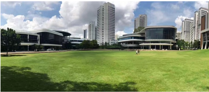
图6 U-Town一角 五、 来自一个路痴的校内交通感想 在校内出行，可以选择步行或者校车，没有什么人骑自行车。因为NUS上下坡很多，有时候步行会比较费劲（而且我比较容易迷路），所以大部分情况，我会选择坐校车。刚开始坐校车，可以按照以下几步走。第一，确定目的地站点：下载App NUS Maps，输入你想去的地点，找到目的地站点的名字与导航方案；或者看平面地图找到站点；但大部分时候，如果不去很奇怪的地点，不用这么麻烦，可以直接知道目的地站点（比如Kent Ridge MRT Station, Univeristy Town）。第二，确定出发站：下载App NUS NextBus，找到离你最近的站点，走过去，如果不会走可以用NUS Maps或者其他地图导航。第三，确定坐哪一班公交：点开NUS NextBus你所在站点，分别点击各个公交线路；或者在公交站点看站牌找到去往目的地的公交线路。此处一定要注意！！与国内与校外的公交不同，同一班次的NUS校车并非有相向而行的两辆，而是单方向开，比如A2只在道路的一边开。并且很多校车并非环线，一定要看清行进方向，避免在终点站被强行下车的尴尬。还要注意，NUS周末校车半小时一班，可以用App看好到达时间，算准时间出发。第四，根据NUS NextBus上显示的站点，在到达下一站前按校车上的铃，否则校车不会停。如果根据以上四步仍然找不到路线，可以多问问路人，或者在刚开始的时候与同学结伴出行。NUS的楼梯很绕，特别是各个教学楼中，但路标很明确，只要跟着路标走，等多走几次就习惯了。