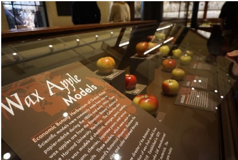
哈佛的自然博物馆

麦吉尔大学的雪 来加拿大还有个好处就是去美国也是件非常轻松愉快的事（有人说加拿大是美国的后花园，感觉反过来说也可以）。多伦多离纽约非常近，飞机一个半小时就到，如果也有美国签证的话完全可以来一场说走就走的旅行。Niagara Fall也只有两小时的车程，而且如果你能游过瀑布河你也就到了美国了。