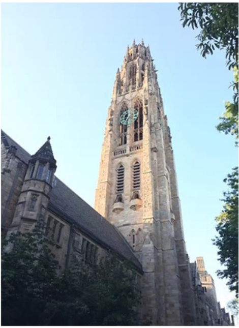
哈克尼斯钟楼 Harkness Tower