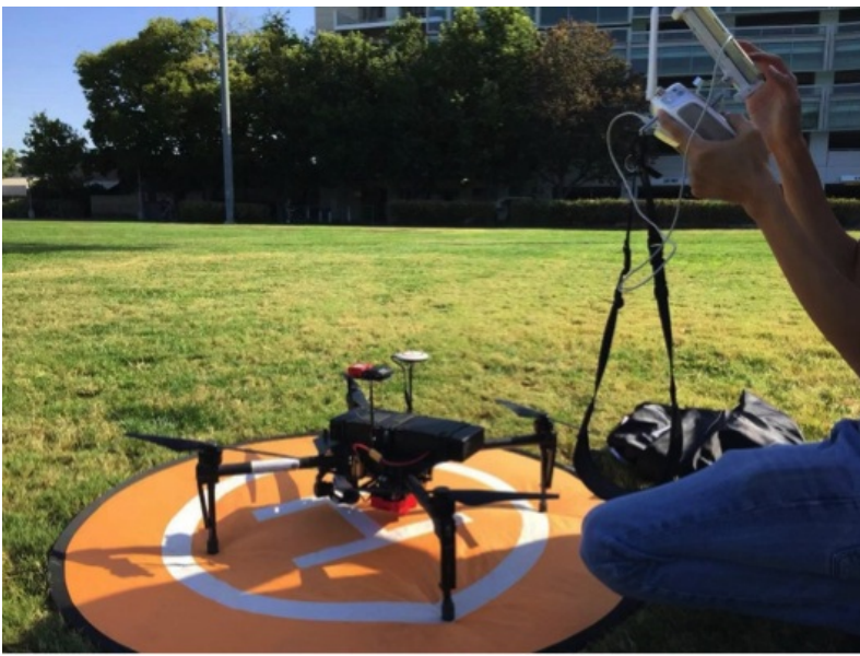
Figure 3 无人机飞行实验

环境法课程则是每周两次授课一次讨论课。在此课程中，我学习了英美普通法的基本体系、多个与环境相关的联邦法案，分析了多个加州环境污染案例；并独立完成10页研究文章，分析了美国跨国水污染的法律争议，这10页法学论文荣膺此课的最难任务。尽管国内的专业英语也有写全英文文的要求，但是本地学生从中学开始就学习如何写research paper，写作能力毫无疑问更胜一筹。环境法课程的特色还在于，授课老师是加州自然资源部的环境立法律师，课堂中现实案例顺手拈来，极具说服力。本学期的大部分精力都放在课程的学习上，所幸功夫不负有心人，最终的成绩也令人满意（A+, A, A）