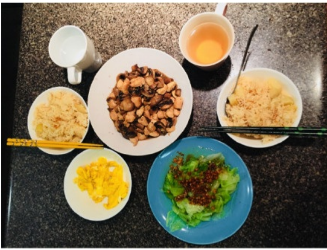
Figure 6 平安夜家常菜

4. 倾盖如故 孤独是留学生的常态，所幸在这一学期里，有不同的友谊陪伴着我适应环境。和五位室友的合作与陪伴是基石。因为有朋友同行，踏出国门之时、畅游美洲大地之时、和租房中介斗智斗勇之时，才不会过分担忧，不会因孤立无援而惊慌失措。和当地学生的友谊是必要的，一次又一次课前课后闲聊生活八卦，讨论作业问题，都让我和当地学生的关系逐渐加深，尽管语言沟通上仍有一定代沟，但如常地和当地学生交往能让自己异乡人的身份淡化了不少，受到认可的感觉增添不少。我曾和当地学生一起参加麦田迷宫等当地特色活动、一起约图书馆自习、一起在咖啡厅讨论诸如政治种族等话题。和当地留学生的友谊是珍贵的，尽管与当地学生能正常沟通，但中文作为母语还是无法替代的存在，和留学生朋友一起买菜、喝早茶、约自习，以及必要时候的互相帮忙，都让心里温暖的感觉有所增益。出国前曾被美国朋友提醒，到了异国千万不要和华人抱团，要跳出舒适圈尽力融入当地社会。在UCDavis生活一段时间之后，我认为和华人抱团其实有必要之处，特别是初来乍到之时，实在需要同声同气的朋友多加帮助。当然不可否认，过分抱团会加深美国社会对华人群体的不了解，更不利于改变当地人对中国的固有偏见。因此对个人而言，需要平衡和华人留学生还有当地学生的交往，能互相帮忙的同时也能较好融入当地社群。 在美国的四个月还有数不胜数的有趣细节和惊险故事，一次次的挑战背后是对自己适应能力的自信，敢于跳出舒适圈勇气。很感激在本科阶段能得到这样一次刷新自己价值观的机会，和UCDavis的留学生和授课老师交流过后，更加坚定了出国读研的想法。前程远，希望能再有踏出国门继续历练的机会。