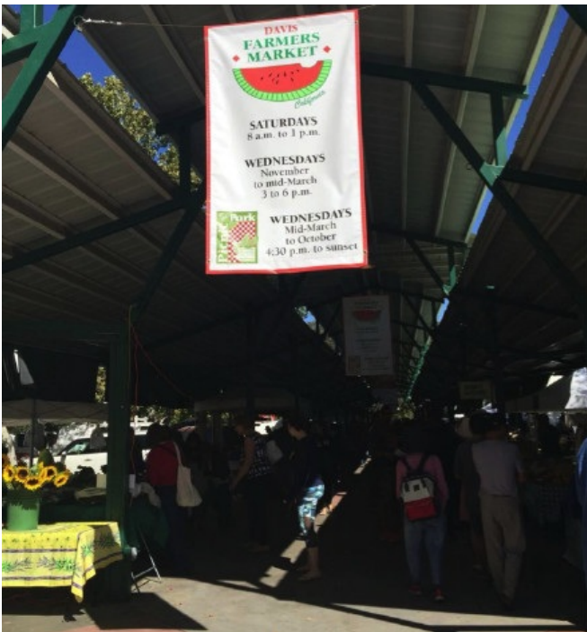
Figure 5 戴维斯小镇农夫市集

3. 此心安处是吾乡 由于UCDavis宿舍紧张，我和同行5位同学只能在学校附近租房子，不过也“因祸得福”从而练就烧菜的本领。从一开始的手忙脚乱到学期末的游刃有余，烹饪出来的家常菜早已成为慰藉自己中国胃的一大帮手。在紧张的学业之余，在每周农夫市集买菜和日常烹饪也晋升为另类的减压方式。租房子也是交流期间的一大考验，转租时与中介的来回谈判，在各大社交网络发布租房信息，与租户们的多次协调都让我们感受到离开宿舍独自租房的不容易，也刷新了自己对社会的原有认知。