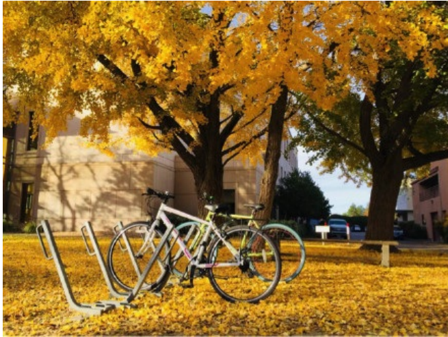
Figure 1 UC Davis一隅

序言 118天的异国生活就这样过去，16小时的时差在归国第一天早已倒好，可对骄阳似火之地的思念才刚刚开始发芽。想念沉浸在学业中的满足，旅途撒欢儿的畅快，感恩节一起煮大餐的温馨。最想念的，还是那个如海绵被扔进汪洋大海般适应新环境的自己。曾经看过更广阔的天地，就再也抑制不住闯荡世界的念头。1. 客从何处来 踏入复旦校门伊始便把出国交流视为本科目标之一，被拷问“为什么想要出国交流”时才开始深挖过去的蛛丝马迹。一方面是家庭的督促，父母同事的子女都陆续在高中、本科、研究生阶段出国，同侪压力化作父母的期望；一方面则是自己内心对更广阔世界的追求，想要跳出一个又一个习以为常的文化圈子，在陌生的环境里发掘自己的潜能。正因一直向往着公派出国，托福这一英语成绩早在大一下学期便准备妥当，加之学校看重培养国际化人才，交流机会充足，我得以在大三上学期踏上前往太平洋彼岸的加州，进行为期约四个月的交流学习。加州大学有近十个分校，根据UCEAP项目的要求，我提交了意向的三个校区，最终分到UCDavis分校，在农业与环境学院修读，该学院是UCDavis的强项。UCDavis坐落在加州首府萨克拉门托附近的戴维斯小镇。意料中的加州骄阳，一尘不染的夜空，适宜骑行的校园，陪伴了我多个日夜。