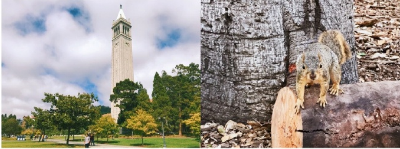
图：Sather Tower 与校园内松鼠

我是2017级经济学院国际经济与贸易的学生，2019年通过校级交流项目在加州大学伯克利分校（University of California, Berkeley）交换一个学期。加州天气宜人，阳光明媚，几乎每一天都是蓝天白云。校园很大，树木草地构成遍目的绿色，常常看见躺在草地上野餐晒日光浴的人们、在草地上进行体育项目的club成员，多处可见松鼠、小鸟，有时还会有小鹿出没。校园中还穿梭着一种无人送餐机，路人常常帮它们调整路线，互动很是有爱。