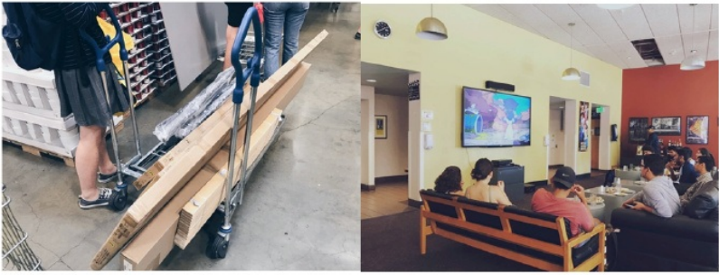
图：在宜家购置床板（左）与食堂一角（右）

由于2020年的新冠疫情，今年的交流活动都暂且搁置，2019年秋季的我们成为了特别幸运的一批学子，我相信每一个跨国交流的学生，都能在各种同与不同中有所感受和体会、有所学习和收获。希望谨以此份交流小结不仅总结自我，也能作为中外交流学生的一个缩影。再次感谢学校和外事处提供如此珍贵的交流机会，我收获了学术层面、文化体验、独立生活等各方面的成长，能以更宽广的视野去看待世界万物，“Seek knowledge. Locate passion. Change the world.”（文中照片均为本人拍摄）