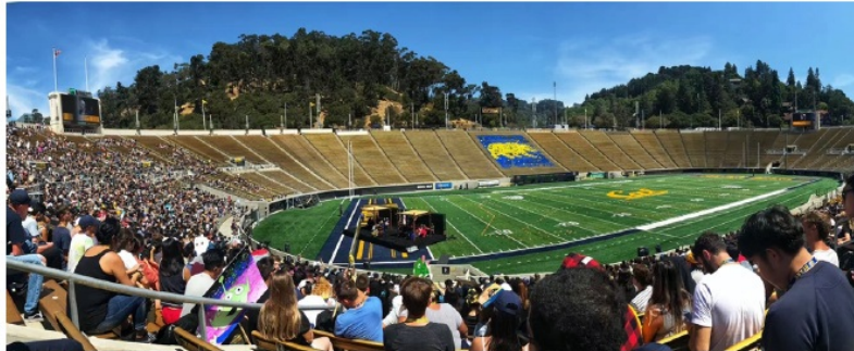
图：伯克利球场现场

相比于中国高校，我认为伯克利等美国高校的学生往往会有更强的归属感，这也是深受美国文化背景的影响。美国人喜欢且重视体育，主要有四大球，即橄榄球、冰球、棒球、篮球，因此美国每个学校和城市都有自己标志性的球队。体育精神融入校园文化之中，成为一种标志，伯克利将此汇聚为一句“Go Bears!”的口号之中。运动和球队成为文化的一部分，空旷的球场会因为此起彼伏的口号而热血沸腾，每个学生都想为自己的学校呐喊助威，场面极其热烈，身处其中，我仿佛早已是一名“当地人”，尽情呐喊：“Go Bears!”