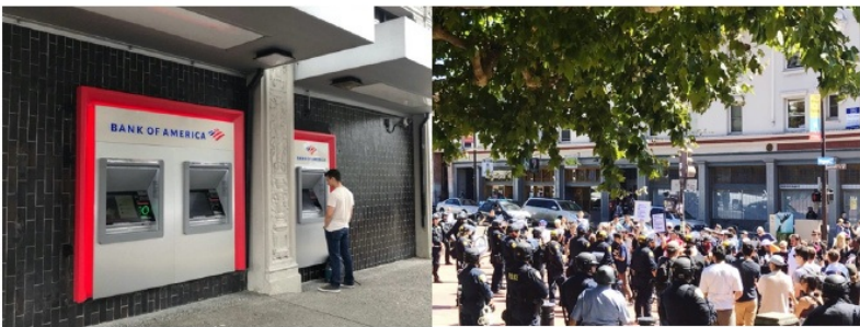
图：敞开的 ATM（左）和抗议现场（右）

由于文化和法律差异，安全问题一直是留美学生十分关注的话题，包括人身安全和政治安全。在伯克利的街头，你会见到随处可见的流浪汉，你会闻到扑鼻而来的大麻味，你需要在敞开式的ATM机上完成交易。留学生们总会避免在夜间出门，其实当地人也是如此，大家不会去避讳谈论日常生活中存在的一些安全风险，开学初的新生周上，不仅有学校统一安排的安全宣讲会以告诫新生注意各方面的安全，包括饮酒、性行为等，我遇到的学长学姐也都细心提醒并解答我们在此方面的疑虑。此外，学校也有许多相应的举措，例如 BearWalk，是伯克利大学的校园服务，对于学习到深夜的伯克利学生，可以免费申请bodyguard护送回家，工作时间是天黑到凌晨3点，也会有安全专线提供给学生。交流期间，我能经常在伯克利校园区域看到一些人们的抗议，有的是个别人士，有的是群体行为，话题也很丰富，包括经济和就业、LGBT等，但抗议人士的行为主要仅限于观点的传达，完全没有涉及暴力，因此我把这看做在特定文化环境下合理表达诉求的现象。交流期间遇见了不少冲突，但我又能在冲突背后看到一种平衡和稳定的力量，更看到了无数温柔且平和的互助，我想这是这个文化环境的张力。