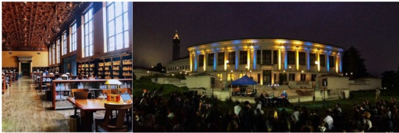
图：Doe Library 内部（左）与夜色中的音乐会（右）

伯克利的Doe Library是校内最大的图书馆，它的设计和构造具有古典的历史感，一走进仿佛置身于一座巨大的历史博物馆，墙上的史料述说着伯克利历来的大师人物，在此学习之时仿佛置身于历史的洪流，在与古人的对话中充盈自己的学习热情和志向。而图书馆外的大草坪却是五彩缤纷，白日有时会开展小型体育活动，而夜晚有时会开展小型的音乐会，气氛或青春或浪漫，与图书馆的背景相融相交，使得在这里的学习生活丰富多彩，从不乏味，即使只是站在草坪旁作为一个旁观者，也能从中获得能量和活力。