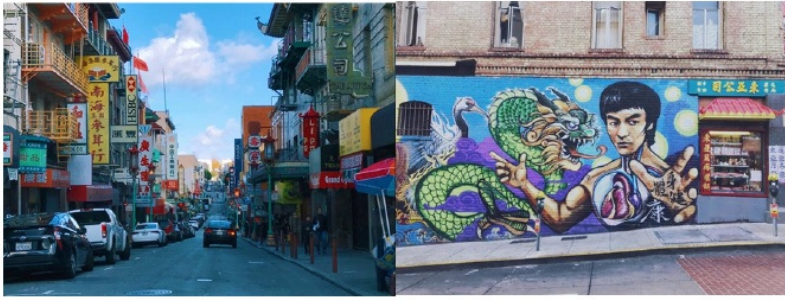
图：旧金山的中国城

学校外事处的平台搭建、感谢那个敢于去向教授申请的自己、感谢教授的接纳和指导、感谢同组成员的共同努力，我希望这个学术起点可以始终存于内心，在之后的学术道路上也能不忘初心，怀揣最初那份热忱。文化感知和生活磨炼 加州的天气很温和，就如这里的文化环境一样，十分包容和多元。这里的人十分热情和友善，在路上都会有陌生人和你打招呼，和你说“Have a good day!”、“How are you today?”最初还会有点反应迟缓，不知如何与陌生人“尬聊”，之后逐渐习惯了当地的这种处世方式，并被一个个小细节所温暖。例如，每一位学生在下校车时都会对司机说“Thank you”，而司机也会回应“You are welcome”“Have a good day”，没有人会对这一声声厌烦，这些反倒成为人们习以为常的礼节。这里的社会风气比较自由，大麻在此地合法，由于天气适宜也成为流浪汉的聚集地，各色各国的人们在街角交汇，和而不同，创造文化和感知的碰撞。