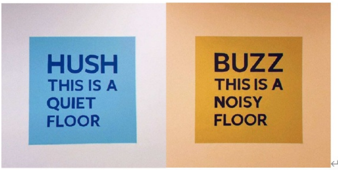
图：图书馆中的静音区和讨论区

伯克利的Doe Library是校内最大的图书馆，它的设计和构造具有古典的历史感，一走进仿佛置身于一座巨大的历史博物馆，墙上的史料述说着伯克利历来的大师人物，在此学习之时仿佛置身于历史的洪流，在与古人的对话中充盈自己的学习热情和志向。而图书馆外的大草坪却是五彩缤纷，白日有时会开展小型体育活动，而夜晚有时会开展小型的音乐会，气氛或青春或浪漫，与图书馆的背景相融相交，使得在这里的学习生活丰富多彩，从不乏味，即使只是站在草坪旁作为一个旁观者，也能从中获得能量和活力。