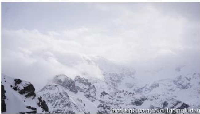
在瑞士铁力士山时所摄

从可怜的咸鸭蛋到惊人的糖醋猪肋骨 当我从刚开始略显手忙脚乱的生活到后面的井井有条、津津有味时，才发现，学会“一个人”生活真的很重要。卢森堡经得起忙碌，也容得下惬意。忙碌时查文献、看电子书、准备pre，独自坐在电脑前承受发呆和抓狂；但更多的时候，一个人，意味着能够按照自己喜欢的方式去打理生活，将自己脱颖而出的本性付诸日常的琐碎之中，不会被不必要的课程和任务束缚，更不易被其他人所左右。不是主张脱离他者离群索居，而是培养一种从以往的舒适圈中脱离出来的能力，更清晰地审视自己。有阅读的时间，亦有思考的空间，视野广阔，人就会变得包容；经历丰富，人就不会显得乏味。如果说交流学习一定要达成什么成就的话，我希望是学会如何和自己相处。四、旅行 卢森堡的地理位置极好，平日里，我和同行的小伙伴趁着周末去法国梅斯、比利时布鲁塞尔等周边国家以及卢森堡的申根、大峡谷等景点分别进行过1-3天的短期游，圣诞假期里我们又和德国以及瑞士的同学去了德国、瑞士、奥地利、布拉格和巴黎旅行了20多天，虽然赶路非常辛苦，雪山超级冷，假期住宿难找又很贵，我还可怜地过敏了TT，但真的是一段无法忘却的回忆。有人说，人在青年时期，要见识一些真正宏伟壮丽的东西，超越人类社会尺度的那种。好比如喷涌数千米高的热带火山、航行数日也不见陆地的远洋、燃烧着坠落的千百颗流星、在午夜沙滩上空闪烁的大麦哲伦星云缓缓沉入黑色海洋、巨树撑起连绵无尽的绿色宫殿、滑过船舷的蓝色冰山、比整个城市还要硕大的高积云。在未来许多幽暗逼仄的时刻，这些事物就是我们逃脱的绳索。我在旅行中的所见所闻虽然没有那么“宏伟壮丽”，但是这些城市、山川，都内化为了生命的一部分。