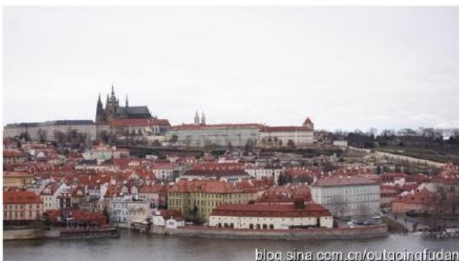
在布拉格查理大桥时所摄