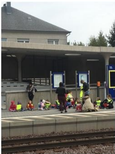
宿舍附近的火车站以及可爱的小朋友

最后一门课程，是法语课，是我为了生存下去必须要选的课2333。卢森堡的车站、超市和饭馆中基本上没有英语，只有法语和德语，虽然当地人很多都会讲英语，交流没有问题，但买东西还是有所不便，因此我选修了一门语言课。法语课的男老师是一位超级gentleman的法国人，举手投足间都是法式腔调，发音也很好听，反正上他的课在视觉上和听觉上都是一种享受~而且他在圣诞假期前就考试了，所以能够减轻我们假期后复习专业课的复旦。三、生活 首先，提供宿舍!!!（这使卢森堡从各个交流项目中脱颖而出有木有！）大学的宿舍是公寓式的，即客厅、厨房、储物间是公共空间，每个人有自己的房间（带浴室、厕所和阳台），从1人寝至5人寝不等，我住的宿舍楼里是男女混住的，这个乍一听有点吓人，但大家还是比较彬彬有礼的，而且除了做饭，大部分时间都可以待在自己的房间，我被分到3人寝，空间很大，即使价格略高，居住感受还是一级棒！地下一层是洗衣房，洗衣机和烘干机都供大家免费使用，机器很多，不会出现使用紧张。阿姨每周一三五回来打扫公共区域，但是不要担心，她不会入侵我们的私人房间哒~唯一美中不足的是，宿舍内没有健身房（喂！已经很好了好嘛，还妄想什么健身房！），但是距离宿舍不远的小镇上似乎有一家。其次，交通非常便利。我从宿舍到学校是坐火车的，在卢森堡，火车的使用率很高，但是几乎每次都可以坐到位子，很宽敞、很舒适，窗外景色多变而美丽，上学路上可以看见草原、牛羊、农田、山峦、住宅区和城市，内设也很人性化，给残疾人、推婴儿车的人、携带自行车的人等等提供了专座和专门上车。卢森堡居民推荐给我一款专门的手机app可以查询火车、公交的路线和误点消息，还能帮你规划最佳路线，在当地比谷歌地图还要流行呢。唯一令我不太满意的是火车误点和突发停靠情况真的有点多，有时会迟到。。。而且没有英文报站。