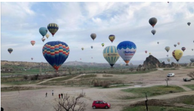
(在浪漫的土耳其坐热气球)

除此之外，我还报名了一些学校组织的trekking活动，去牛津，去Dartmoor，感受英国的别样风情。四月是复活节假期，利用这个长长的假期时间，我飞去曼彻斯特找了我的多年好友，我们一起去了土耳其，在这里，我强烈推荐大家利用好假期的时间出游！不管你是选择签证办理非常方便的土耳其，摩洛哥，还是提早办好了申根签证，打算去欧洲环游一圈，我都一定建议你，把假期好好利用起来，这一年的旅游额度都可以用上！当然，一定不要忽视了安全问题，在外尽兴玩耍的同时，保管好随身物品，和同伴保持联系，切勿独自出行哦~