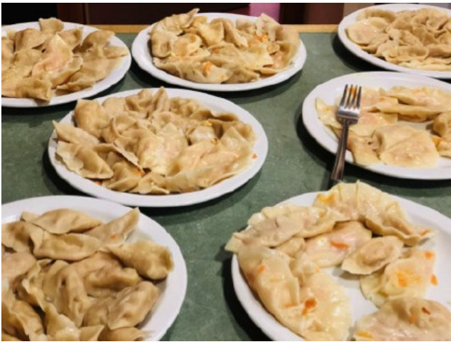
(Exeter Chapel庆祝中国年，邀请中国留学生一起包饺子)

我在Exeter住的学校的accommodation，是studio的形式，即一间“麻雀虽小五脏俱全”的单身公寓，有独立的小灶台，淋浴间，小冰箱，储物柜，衣橱，书桌，还有一张双人床。住宿环境很舒服，自己慢悠悠地经营小日子也很享受。如果非要挑刺，那就住宿费实在不便宜。如果想在住宿这方面省省的话，也可以选择在校外租房住，租房的渠道可以通过学长学姐networking，提前进入学校群看出租告示等，也可以在学校官方网站的公告栏中寻找，一般可以租到的房型有en suite和studio两种，en suite就是独立卧室和卫生间，与其他室友公用厨房&客厅等公共区域；studio就是我自己住的类型，适合喜欢安静和自由，不追求热闹社交的朋友。