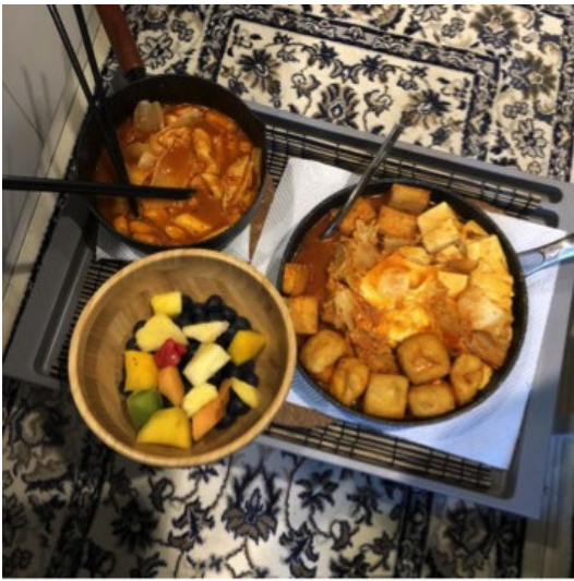
(和好友在studio做的精致一餐)

我在Exeter住的学校的accommodation，是studio的形式，即一间“麻雀虽小五脏俱全”的单身公寓，有独立的小灶台，淋浴间，小冰箱，储物柜，衣橱，书桌，还有一张双人床。住宿环境很舒服，自己慢悠悠地经营小日子也很享受。如果非要挑刺，那就住宿费实在不便宜。如果想在住宿这方面省省的话，也可以选择在校外租房住，租房的渠道可以通过学长学姐networking，提前进入学校群看出租告示等，也可以在学校官方网站的公告栏中寻找，一般可以租到的房型有en suite和studio两种，en suite就是独立卧室和卫生间，与其他室友公用厨房&客厅等公共区域；studio就是我自己住的类型，适合喜欢安静和自由，不追求热闹社交的朋友。