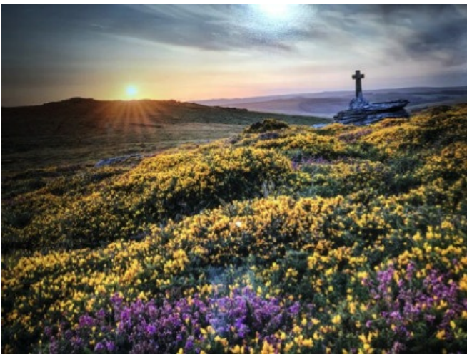
(British Culture课，老师带我们field trip)

社交 Exeter最令我喜欢的社交活动，就是和好朋友一起出行逛街了。我有幸在Exeter认识了一位特别可爱的小姑娘，我们一同上课，做饭，逛Ikea的家具，买zara的衣服，挤在一张小床上看剧，互相疏解在异乡的孤独感。最后我们还一起订了机票回国，直到现在也是非常非常要好的朋友。