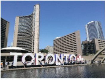
(多伦多的标志和议会大厦)

多伦多属于是比较开放而包容的城市，加拿大移民国家的性质决定了它对不同国家的人都比较友好。如果对加拿大感兴趣的同学一定不要错过了。从夏天的清爽宜人到冬天的白雪皑皑，都是好看的美景。这里既有多伦多电视塔多大校园等人文美景，也有安大略湖，尼亚加拉大瀑布这样的自然奇景。另外，乘坐多伦多的街车与地铁也是不容错过的体验。