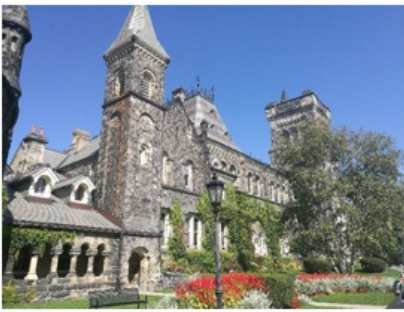
(多伦多大学的标志性建筑)

二、关于多大——实力雄厚，包容开放 多伦多大学给我很深的触动，从它的硬件设施到它的学术氛围都与复旦的不同。多伦多有一百多年的历史了，它有5个学院，其中Trinity（圣三一）学院还是哈利波特的取景地，维多利亚式的建筑非常赏心悦目。